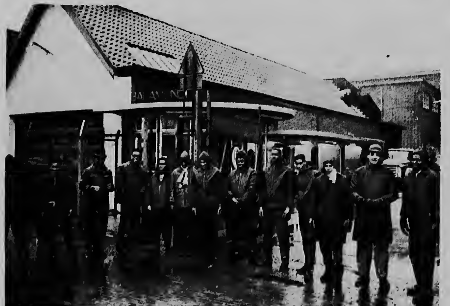
Dilanti di e fabriekspoort di fabrica Balamundi na Huizen, diarionte e trahadornan Antillano ta pasa dilanti di e poort aki.